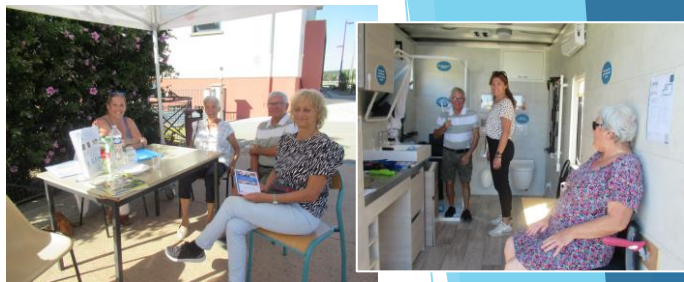
Truck SOLIHA le 19 septembre