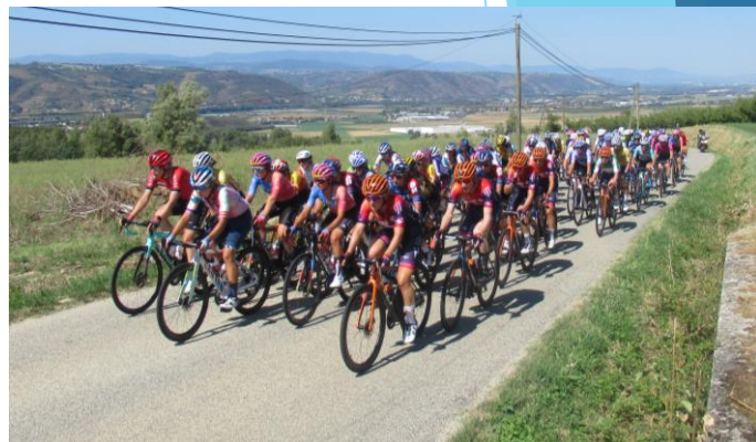
Passage du Tour Cycliste Féminin International de l'Ardèche le 8 septembre